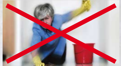
Verwenden auch Sie modernste Reinigungstechnologie und erfahren einen neuen Hygienestandard!