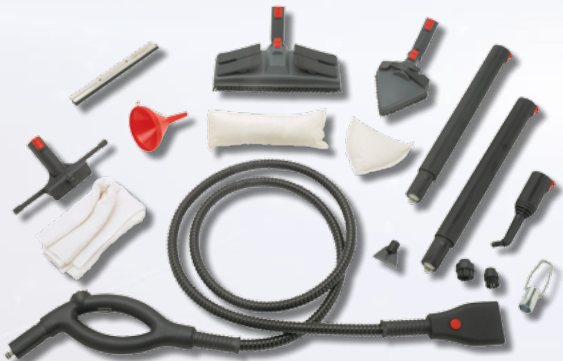
Arbeitsschlauch auch in 5 m oder 10 m lieferbar (Sonderzubehör)

Unser reichhaltiges Sonderzubehörprogramm erhalten Sie bei Ihrem Fachhändler