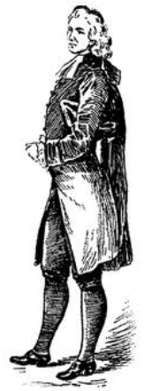
Abbé Faria qui apparait dans le comte de Montecristo : l'imagination