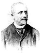
L'hypnose c'est la suggestion <-- Liebault et Bernheim -->