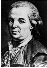
Anton Mesmer (1734-1815), le magnétisme animal