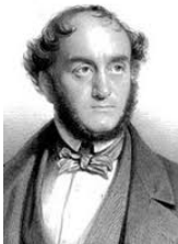
Les chirurgiens anglais et l'analgésie mesmérique <-- Elliotson et James Esdaile -->