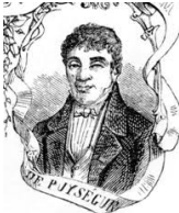
Le Marquis de Puységur : le somnambulisme