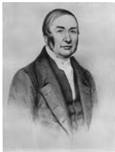
Braid, l'hypnose est un état de sommeil