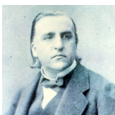
Jean Martin Charcot. L'Hypnose et l'Hystérie