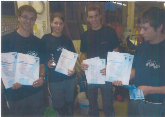
Das Siegerteam mit den Urkunden und dem in Aussicht gestellten Zusatz-Siegergeld des Lehrmeisters

lobt er den Einsatz, «diese Lehrlinge sind ein Rohdiamant.» Sein