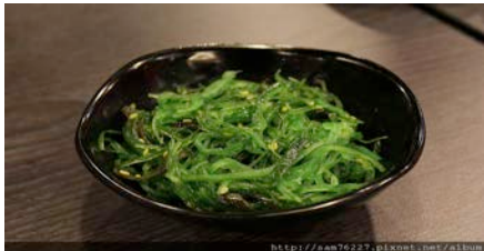
salade de d'algues (Seulement algues) CHF5.50