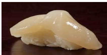
Hotategai(noix de st-jacque)CHF12.00(9.6)