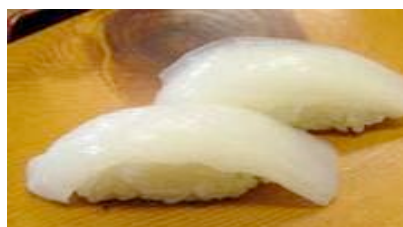
Ika (calamar) CHF 8.00(6.4)