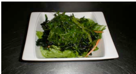
kaisoo salade: salade de d'algues CHF 9.00 (7.2)