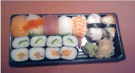
Sushi portion 15 pieces CHF 33.00(26.2) 25.50(20.4)