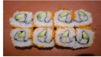
California chair de crabe, avocat CHF 16.00(12.8)