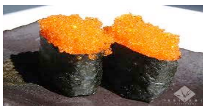
Tobiko(œuf de poisson)CHE9.00(7.2)