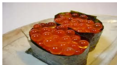
Ikura(œuf de saumon) 10.50(8.4)