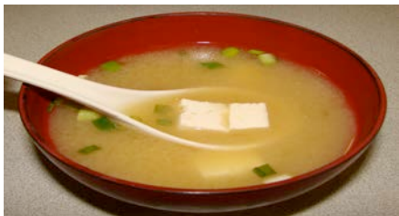
soupe miso aux algues CHF 5.50 (4.3)