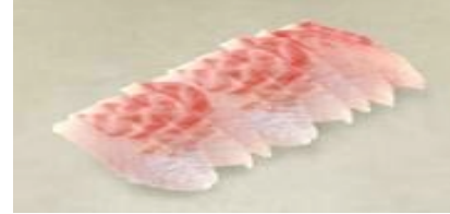
Sashimi dorade 9 pieces CHF 17.00 (13.60)