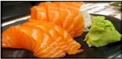
Sashimi de saumon 9 pieces CHF 18.00 (14.40)