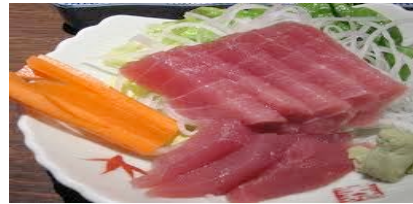
Sashimi de thon 9 pieces CHF 18.00 (15.00)