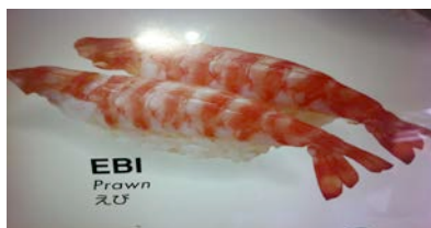
Ebi (crevette cuite) CHF 8.50(6.8)