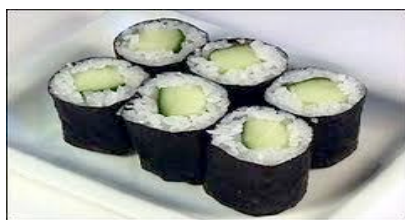
Kappa maki( concombre) CHF8.00(6.4)

Kani maki (chair de crabe)CHF 11.00(8.8)