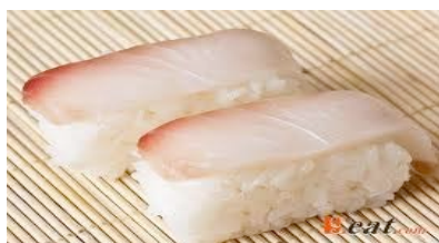
Shilomi(poisson blanc) CHF8.00(6.4)