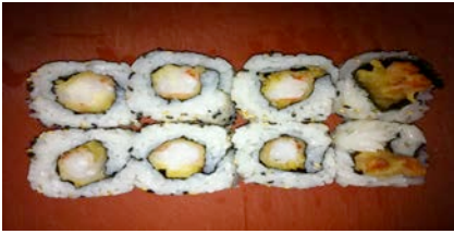
Maki tempura de crevette CHF 18.00(14.4)