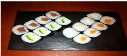
Assortiment de maki 16 pieces CHF 18.00