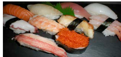
Assortiment de nigiri 10 pieces CHF 35.50(26.5)