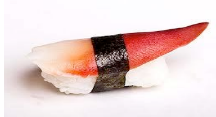
Hokigai(palour de ronde)CHF9.50(7.6)