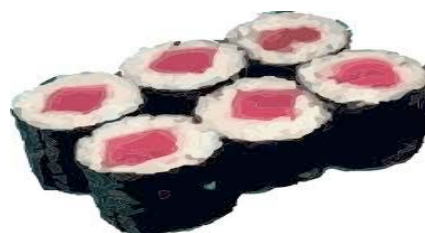
Teka maki (thon ) CHF 9.00(7.2)