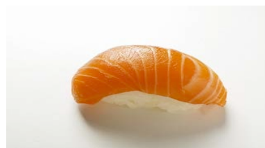
Shake (saumon) CHF 8.50(6.8)