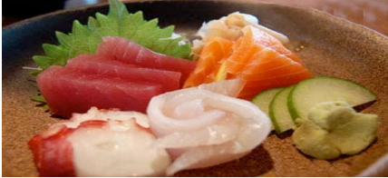
Assortiment de sashimi 16pieces CHF31.00 (24.50)