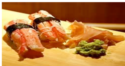
Kani (chair de crabe) CHF11.00(8.8)