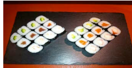
Assortiment de maki 24 pieces CHF