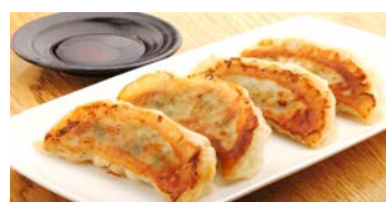
Gyoza (ravioli de légume et poulet) 3 pieces CHF7.50 (6.00)