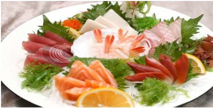
Sashimi royale 25pieces CHF41.00 (32.50)