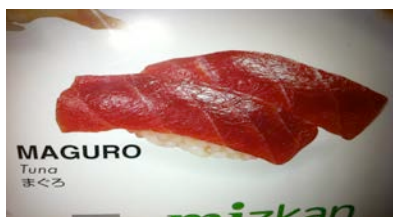
Maguro (thon) CHF 8.50 (6.8)