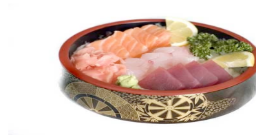
Chirashi sushi 15 pieces