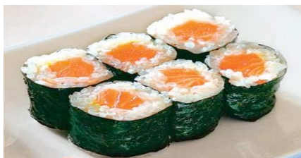
Sake maki(saumon)CHF 9.00(7.2)