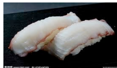
Tako (poulpe) CHE8.00(6.4)