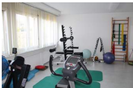
Gut eingerichtete, professionelle Physiotherapie mit medizinischer