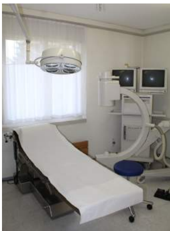
Operationsraum Gipsbehandlungszimmer Durchleuchtungsanlage