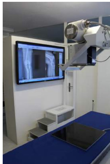
Vielseitige, modern ausgestattete Digitale Röntgenanlage.